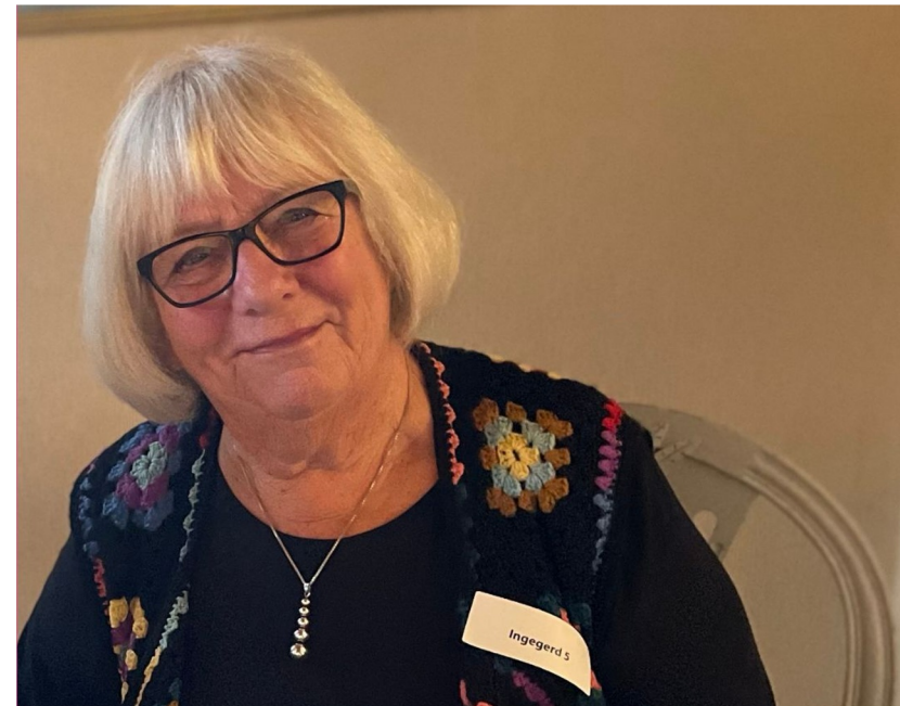
WOW "Träna svenska"

Ny grupp med Tytti - vi återkommer med mer information